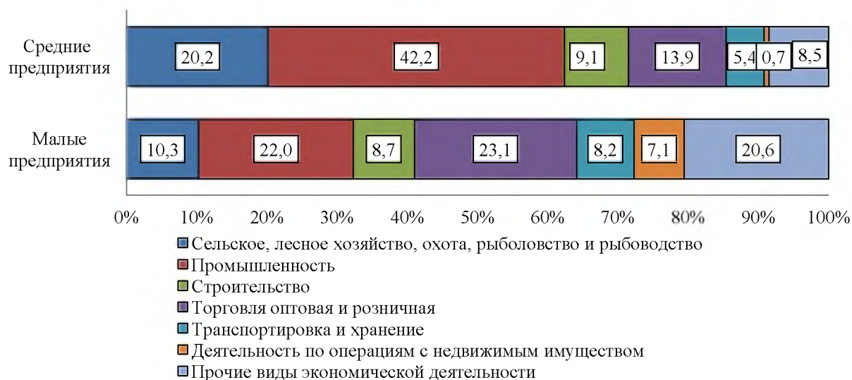
Рисунок 3 - Среднесписочная численность работников (без внешних совместителей) малых и средних предприятий Ростовской области в разрезе видов экономической деятельности за январь-март 2018 года (в процентах)

Четверть работников малых и средних предприятий Донского региона заняты в промышленности, 20,9 процента – в оптовой и розничной торговле. Удельный вес занятых на предприятиях малого и среднего бизнеса в сельском, лесном хозяйстве, охоте, рыболовстве и рыбоводстве по итогам января-марта 2018 года составил 12,6 процента. В таких видах деятельности, как строительство, транспортировка и хранение, операции с недвижимым имуществом, доля работников варьирует от 8,8 процента до 5,6 процента. Структура распределения численности работников малых и средних предприятий по видам экономической деятельности приведена на рисунке 3.