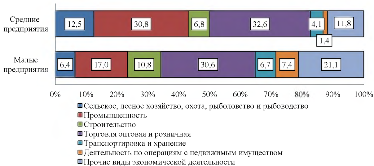
Рисунок 2 – Количество малых и средних предприятий Ростовской области в разрезе видов экономической деятельности за январь-март 2018 года (в процентах)