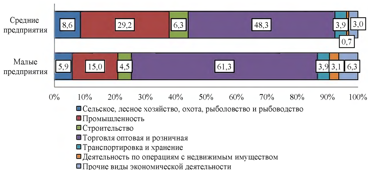
Рисунок 4 – Оборот малых и средних предприятий Ростовской области в разрезе видов экономической деятельности за январь-март 2018 года (в процентах)